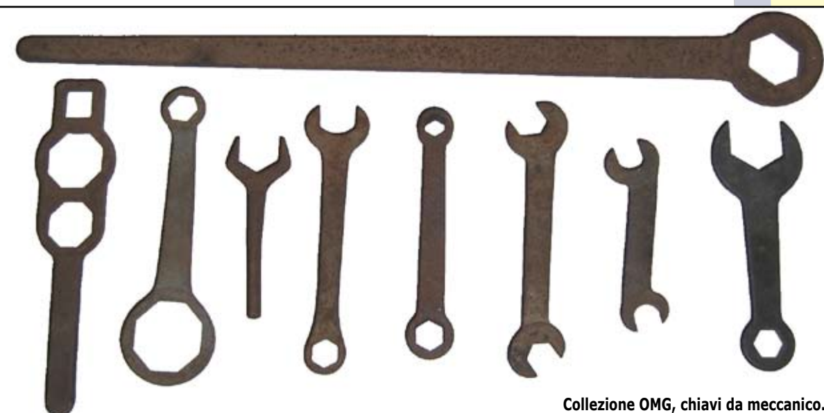
Collezione OMG, chiavi da meccanico.